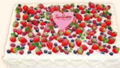
写真は1段 50名様分 本体価格 55,000 円 (税込 59,400 円)

※デコレーションケーキの飾りは、季節により フルーツの種類が変わる場合がございます。